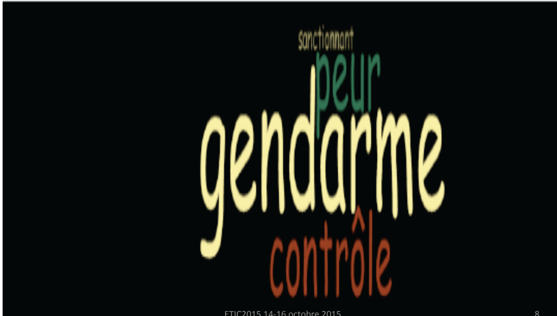
Figure 2 : Nuage de mots du nœud «Failles vécues dans une supervision »

RESULTATS: figure de l'inspecteur gendarme aujourd'hui désuète