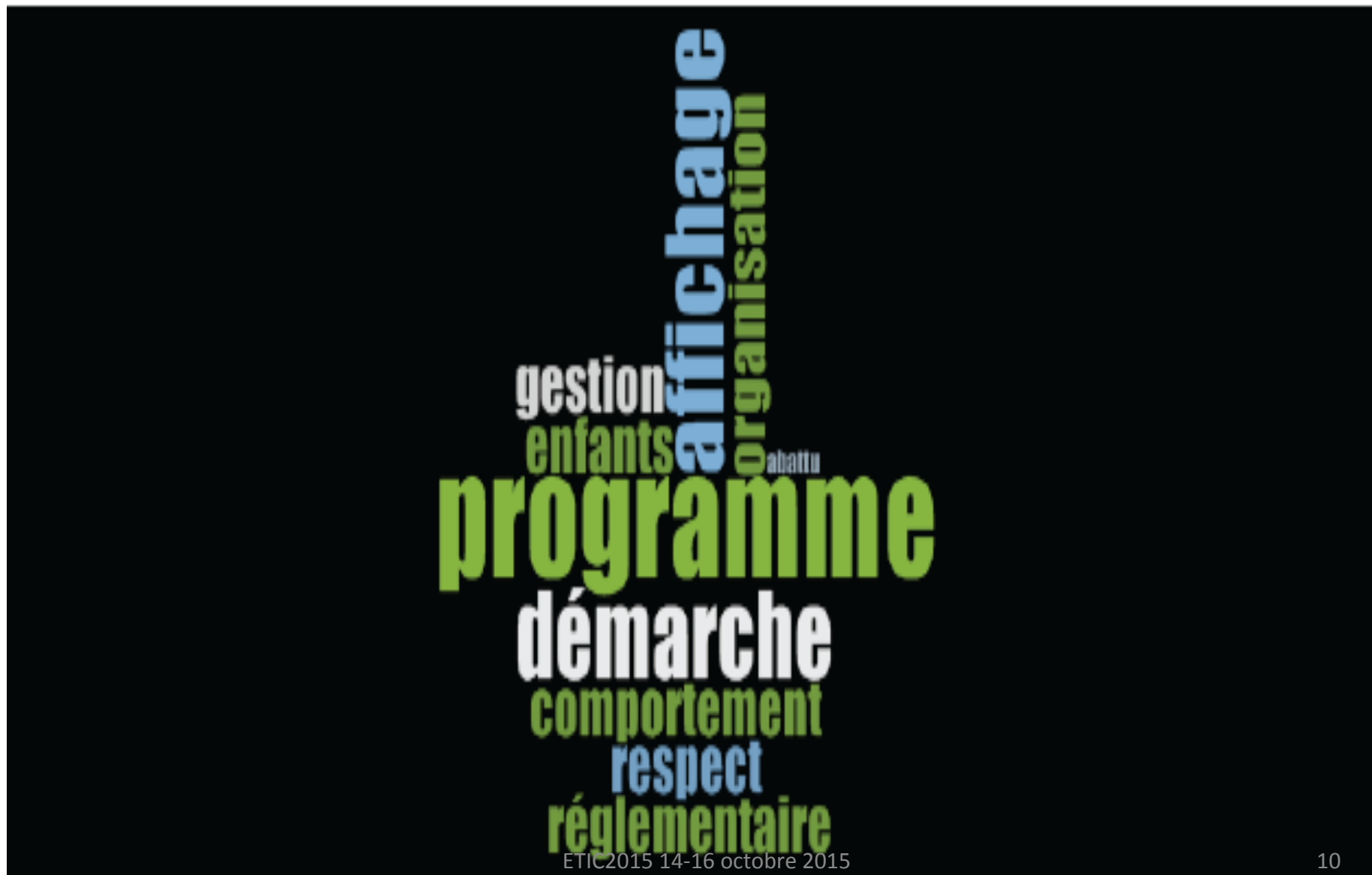
Figure 3 : Nuage de mots du nœud «Indicateurs et critères d'une leçon correcte »